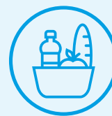
Alimentation & boissons