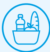
Voeding & drank