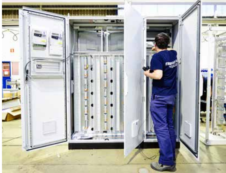
We maken borden die beantwoorden aan uw specifieke eisen.