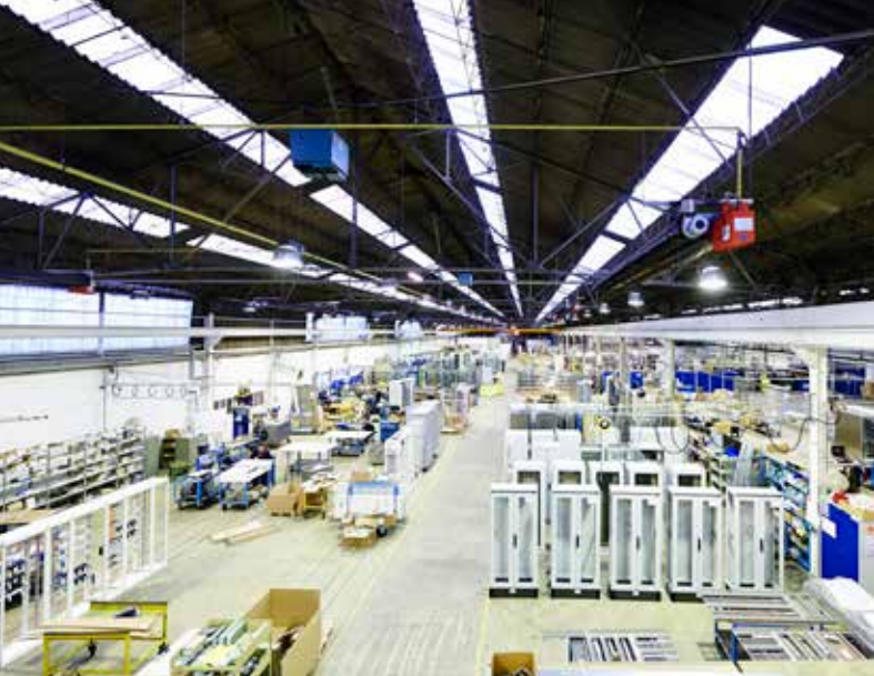
Onze werkplaats van 4 000 m 2 voldoet aan de strengste normen. Er geldt een strikte clean floor policy.